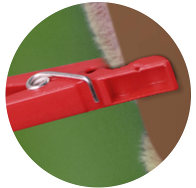
Befestigung mit Wäscheklammern